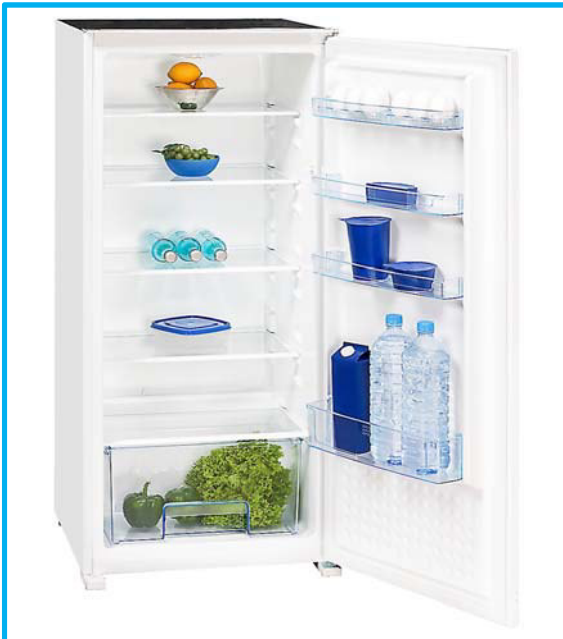
EKS 201-11 RVA++