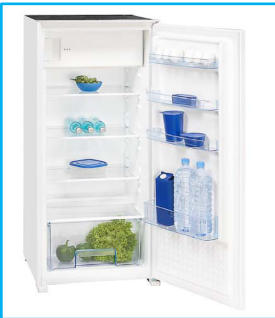
EKS 201-11 A++

Spannung / Frequenz [V / Hz] 220-240 / 50 220-240 / 50 Leistungsaufnahme [W] 110 110 Stromaufnahme [A] 0,9 0,9 Sicherheitsbestimmungen CE CE EAN Nr. 4016572017304 4016572017281